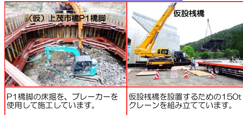
①施工：戸田・岩田地崎JV